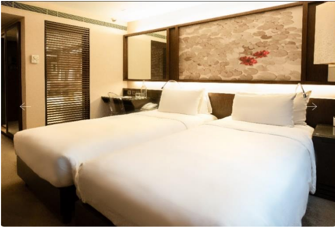
Eaton Hong Kong