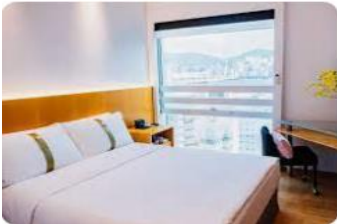
Empire Hotel Kowloon

ARRIVAL : BANGKOK – HONG KONG 02.00 – 05.40 // 03.20 – 07.05 DEPARTURE : HONG KONG – BANGKOK 22.55 – 00.45 +1 // 23.50 – 01.50 +1