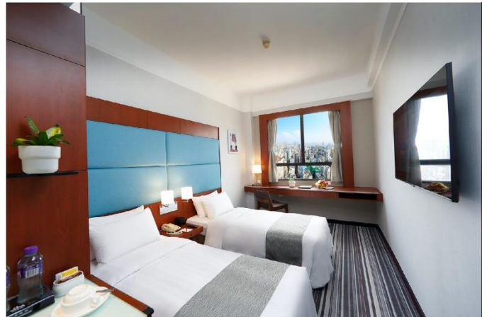
BP Int'l Hotel