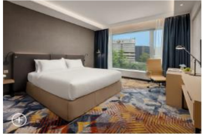
Park Hotel Hong Kong

ราคาเสริมพิเศษรถตู้ Alphard สำหรับ รถรับ-ส่ง สนามบินฮ่องกง - ที่พักฝั่งเกาลูน พร้อมคนขับ ราคา 3,850 บาท ต่อคัน ต่อเที่ยว